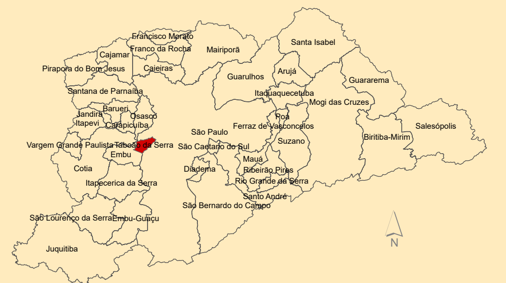
Situação do Município de Taboão da Serra na Região Metropolitana de São Paulo