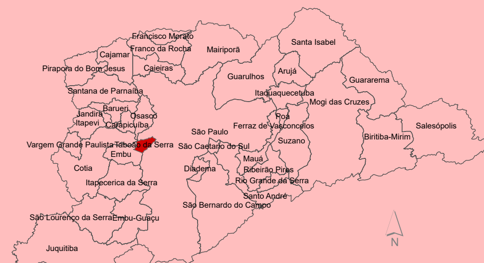
Situação do Município de Taboão da Serra na Região Metropolitana de São Paulo